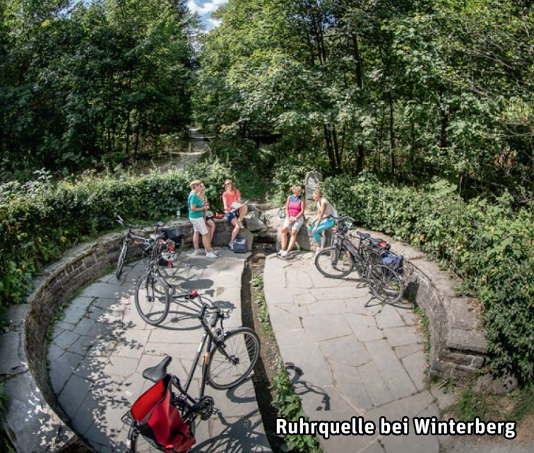
Ruhrquelle bei Winterberg