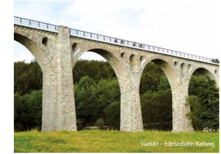
Viadukt – Ederseebahn-Radweg

Familienfreundliche Wege in den Tälern von Eder und Diemel, eine Runde um den Edersee oder auf die Höhen von Upland und Kellerwald – hier finden Sie Touren für jeden Anspruch. Und alles eben miteinander. Dabei fahren Sie immer wieder an beeindruckenden Stauseen, mächtigen Wäldern, die im Nationalpark Kellerwald-Edersee zum Teil zum UNESCO-Weltnaturerbe zählen, und schmucken Ortschaften mit historischem Stadtkern vorbei. Ein Bike-River mit einer Dichte an erlebnisreichen Angeboten wie nicht viele andere.